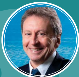
Christophe TAVERA Professeur des universités